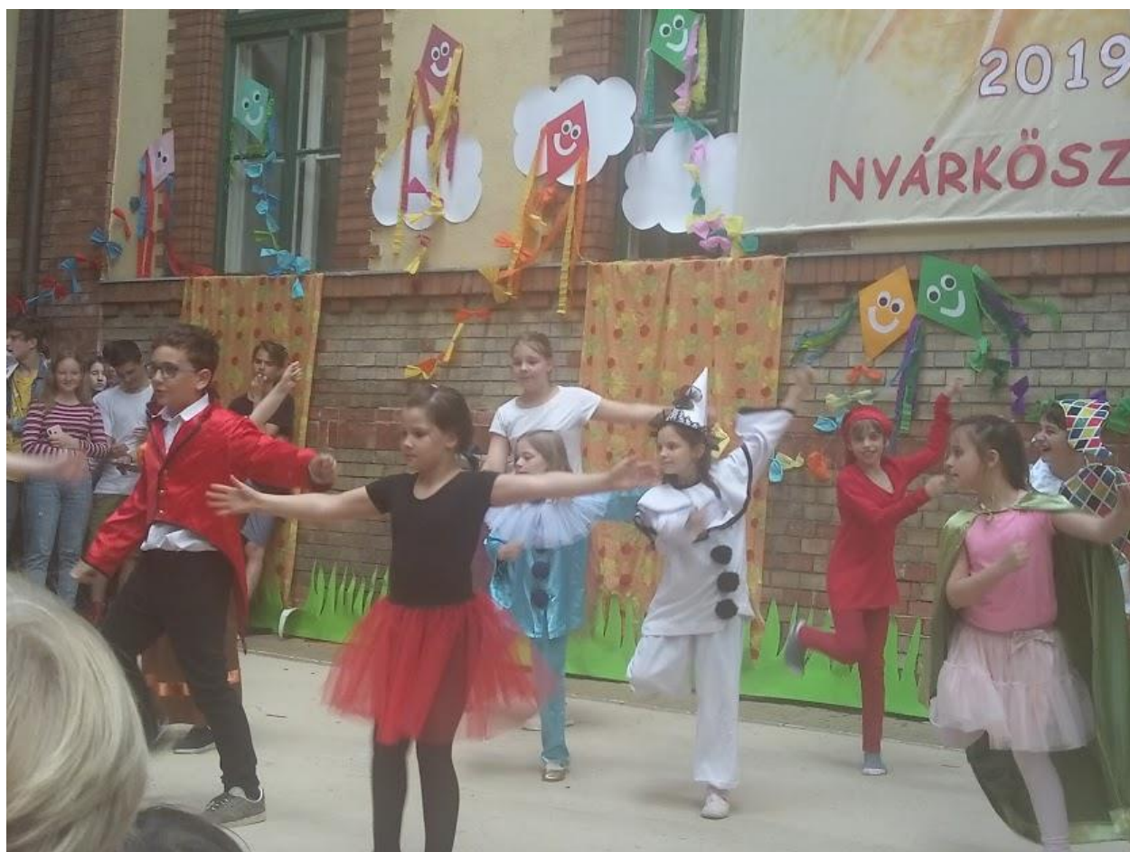
Dzień Dziecka w szkole.