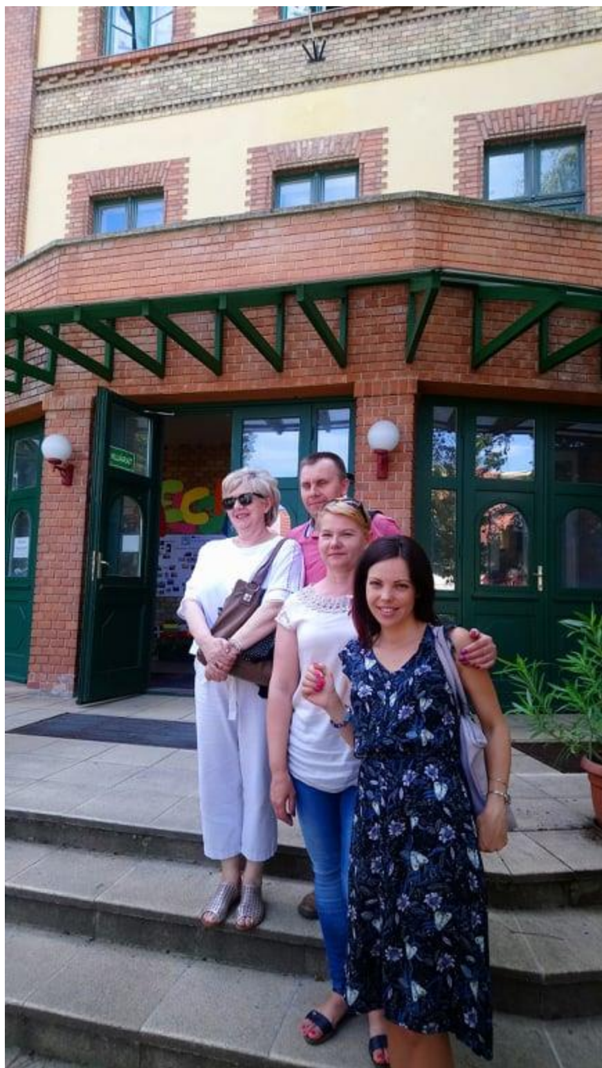
Pamiętkowe zdjęcie przed szkołą.