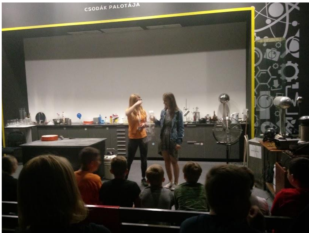
Doświadczenia chemiczne z ciekłym azotem.