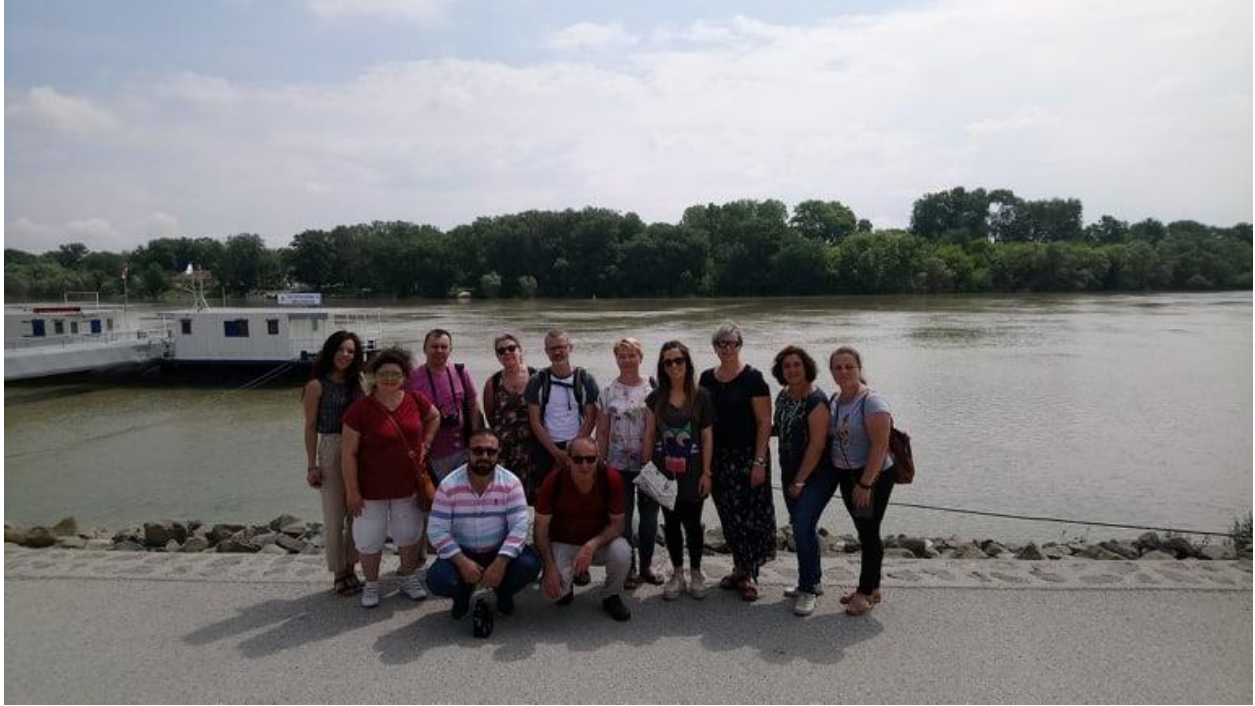
Nad modrym Dunajem