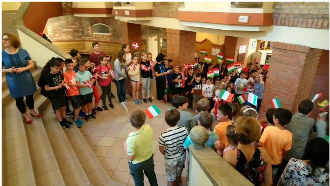
Powitanie w szkole.