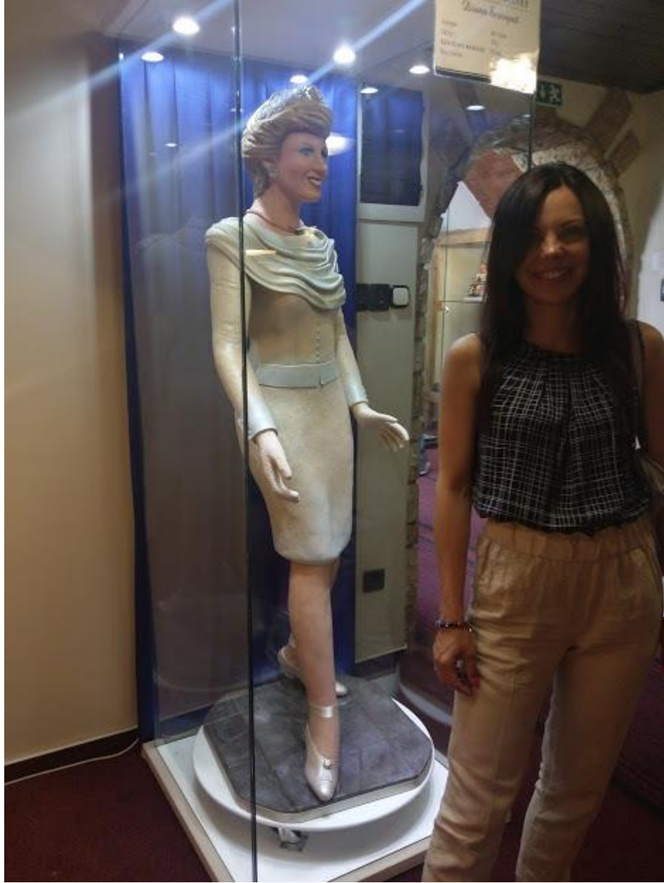
W Muzeum Marcepanu.