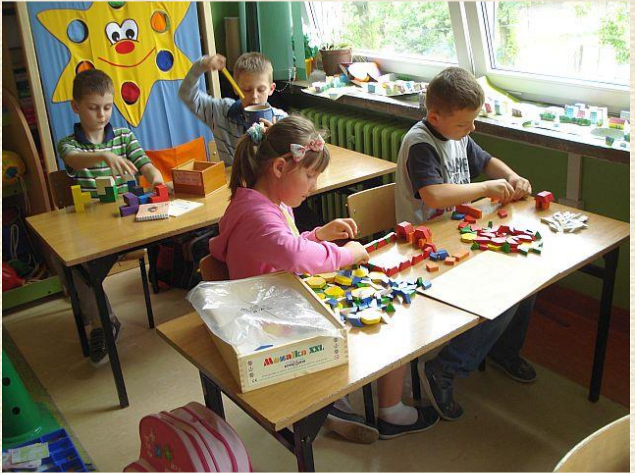
Uczniowie w czasie zabawy