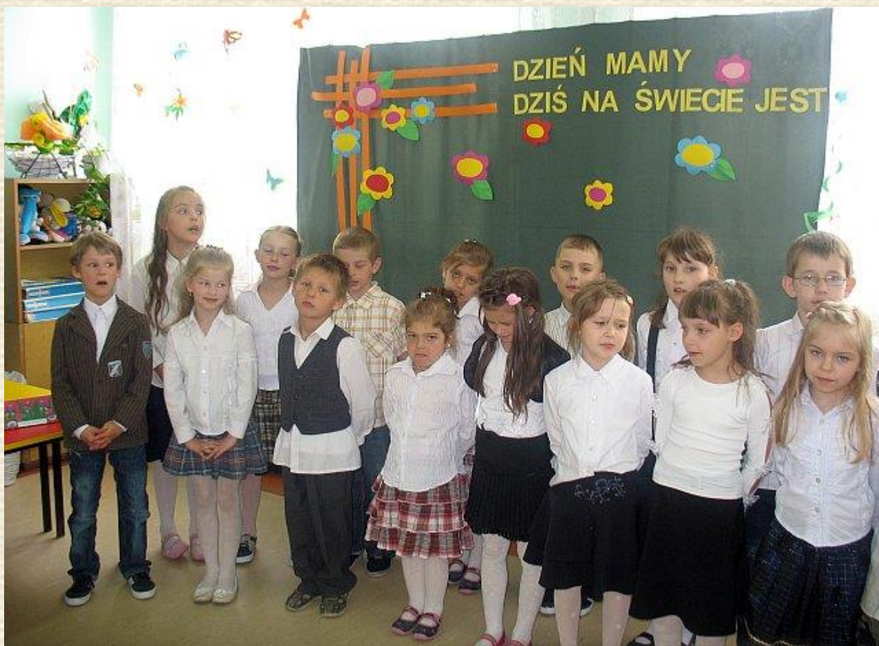
Nie mogliśmy zapomnieć o naszych kochanych Mamusiach.