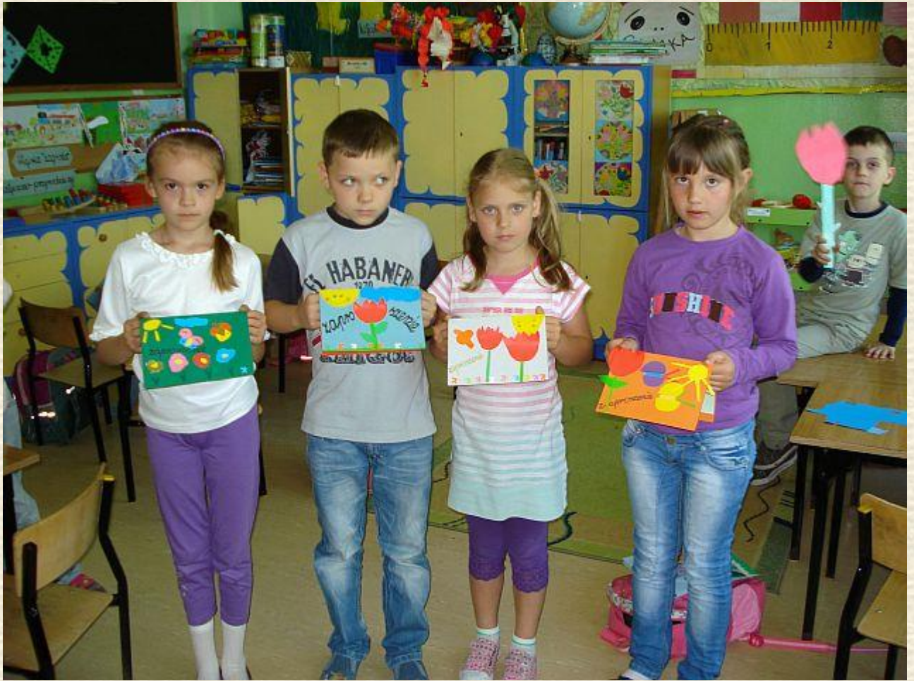
Zaproszenia na końcową prezentację dla dyrekcji i nauczycieli