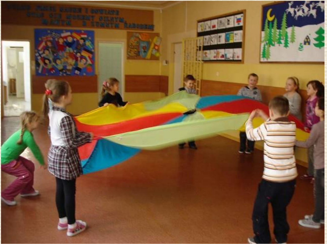
Zabawa z chustą animacyjną