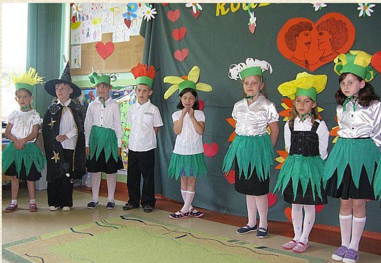
Pokaz efektów końcowych. Przedstawienie pt. "Dzień Rodzica"