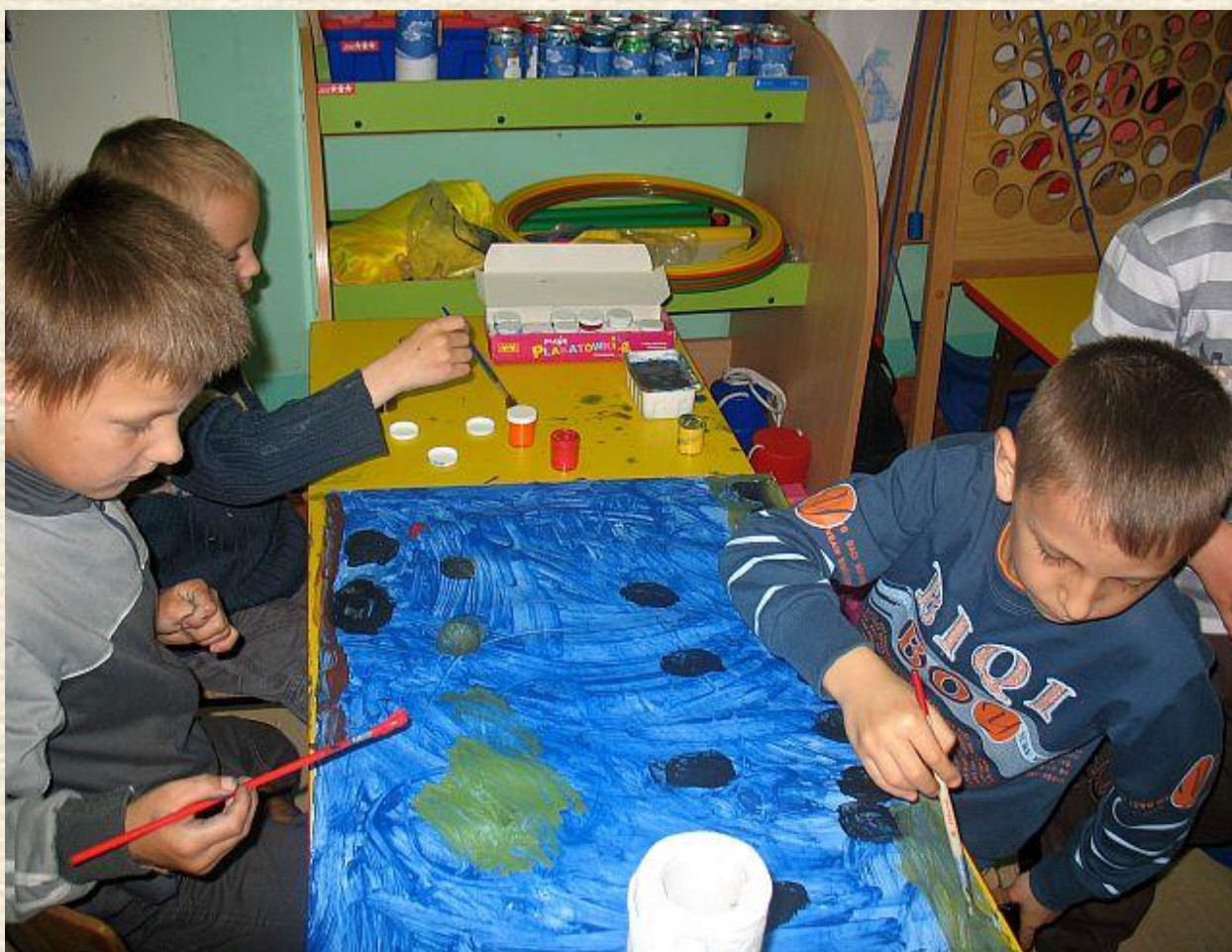
Chłopcy też nie próżnują. Zastanawiają się, jaką namalować rybę.