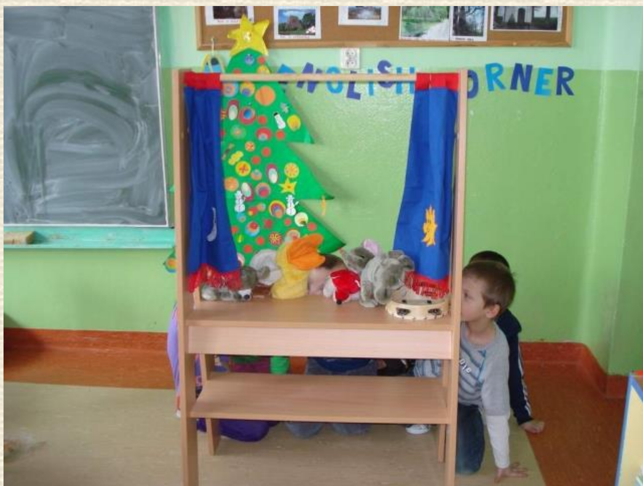
Przedstawienie kukielkowe w wykonaniu małych artystów