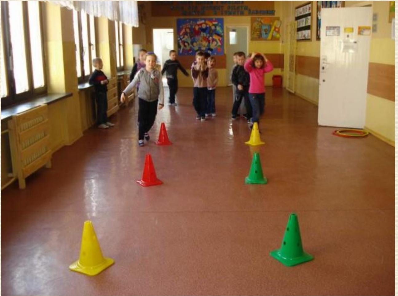
Bardzo lubimy zawody sportowe