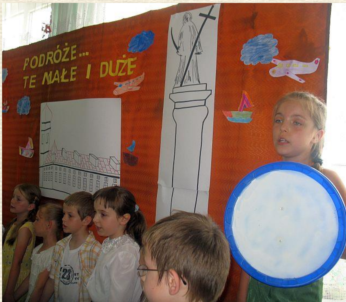
Na pierwszym planie Syrenka, w tle Zamek Królewski i Kolumna Zygmunta III Wazy i oczywiście wielu turystów.