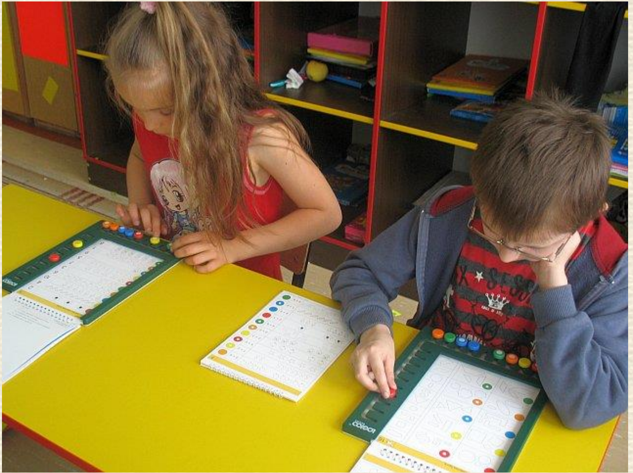
Pierwszaki to nie tylko zabawa. Teraz czas na naukę.