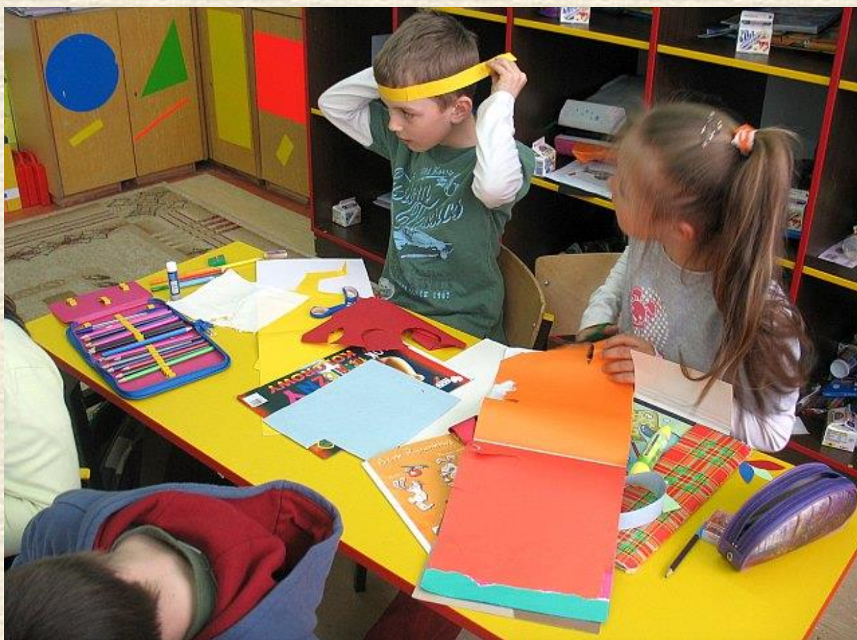
Jeszcze ostatnie przymiarki i... już możemy bawić się w Indian.