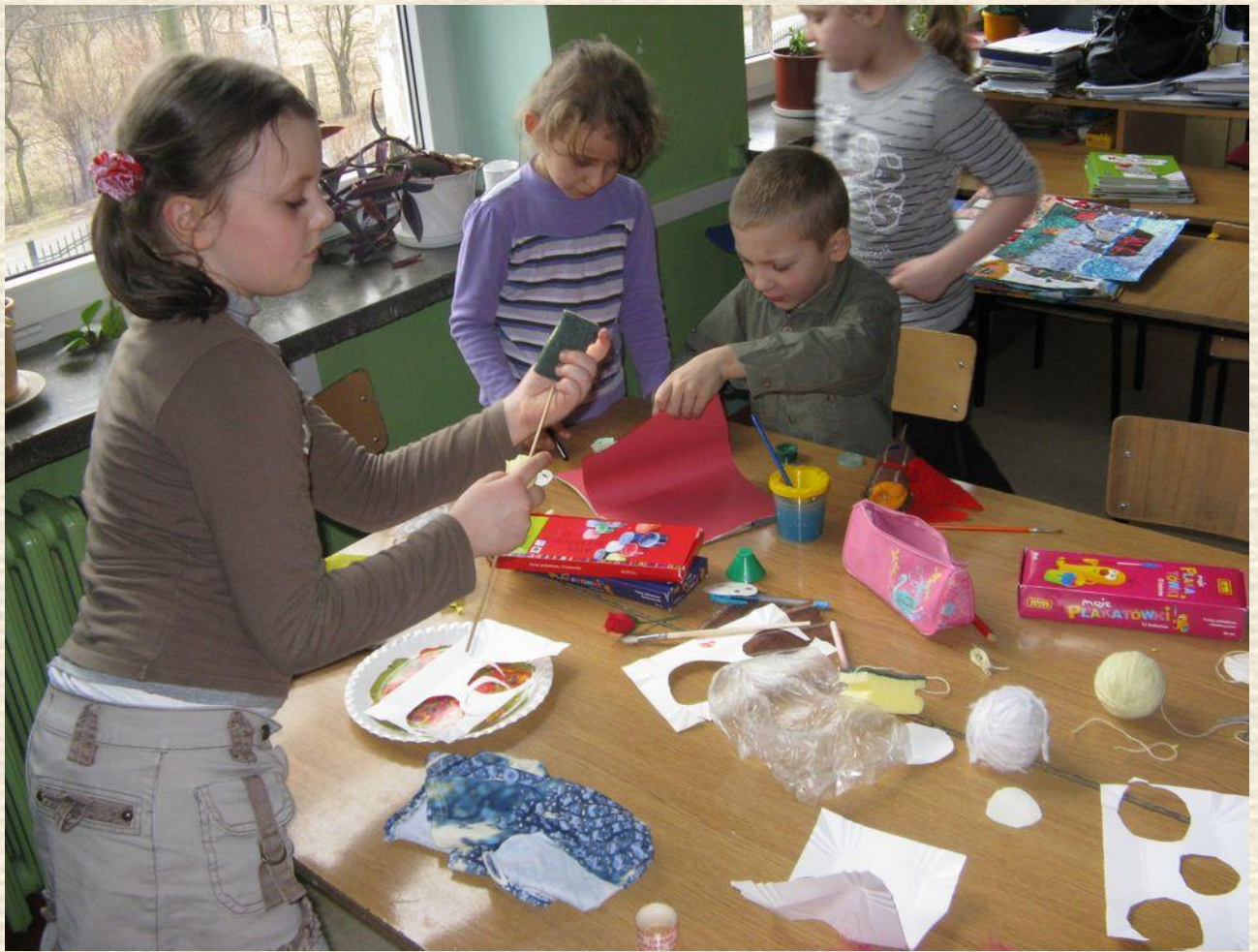
Robimy kukielki do przedstawienia o Kopciuszku