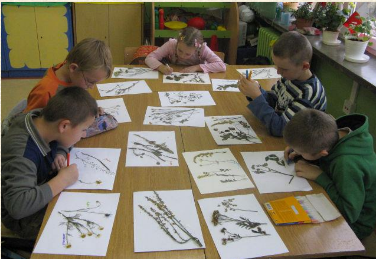
Gazetka klasowa - Jeszcze troszeczkę lata