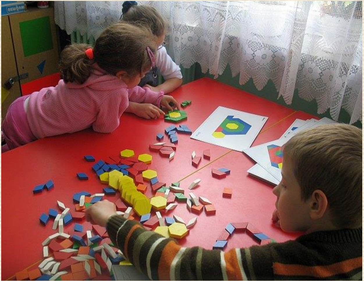
Co trzy głowy, to nie jedna. Wspólna zabawa daje wiele radości.