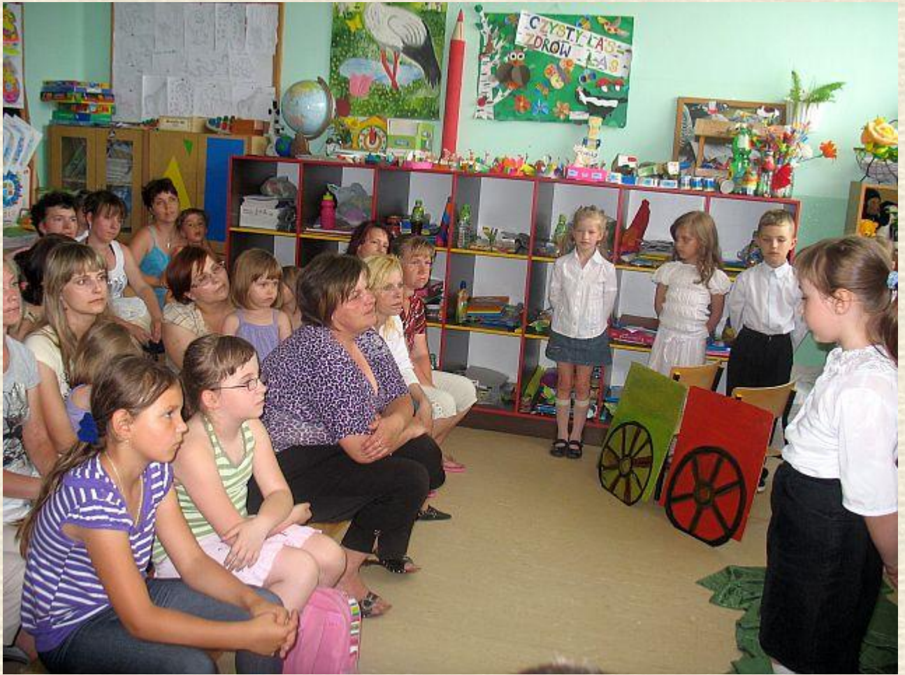
Przedstawienie czas zacząć - pociąg stoi na nas czeka, więc pojedźmy gdzieś daleko... Pokaz efektów Projektu.