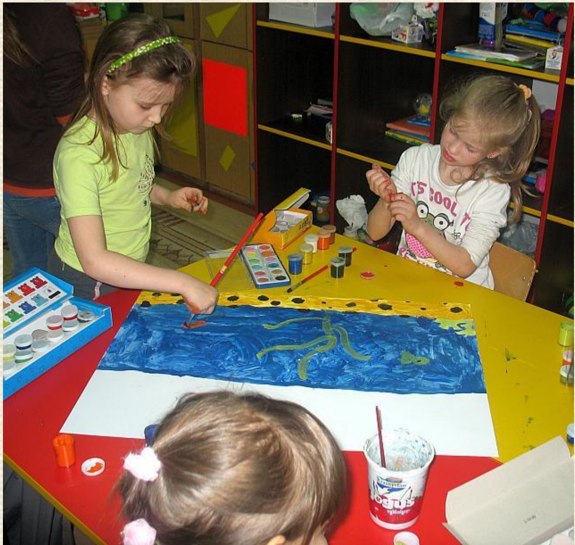
Malujemy podwodny świat, więc wskazana jest praca grupowa.