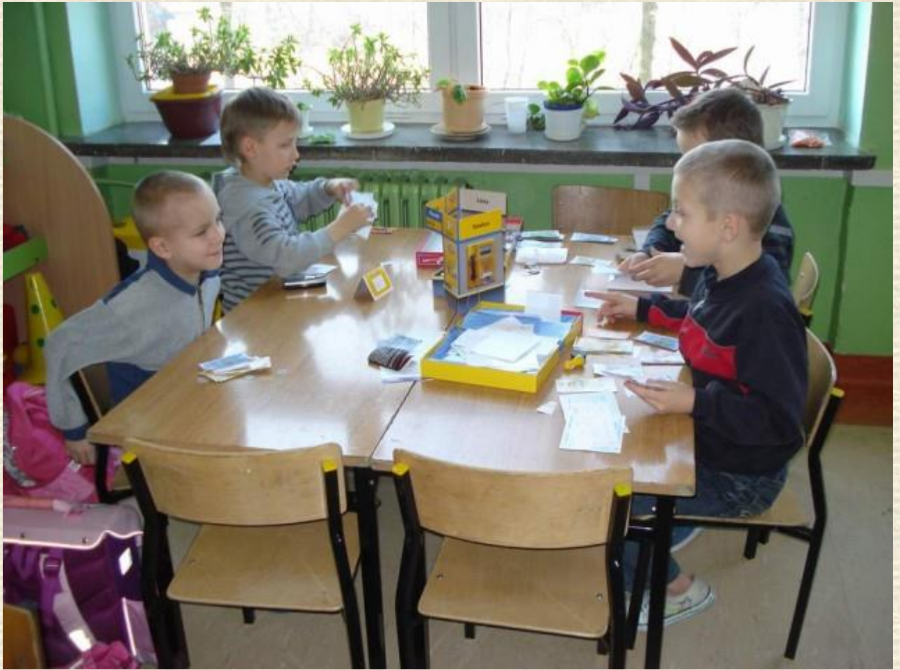
Poznajemy zawody "zabawa w pocztę"