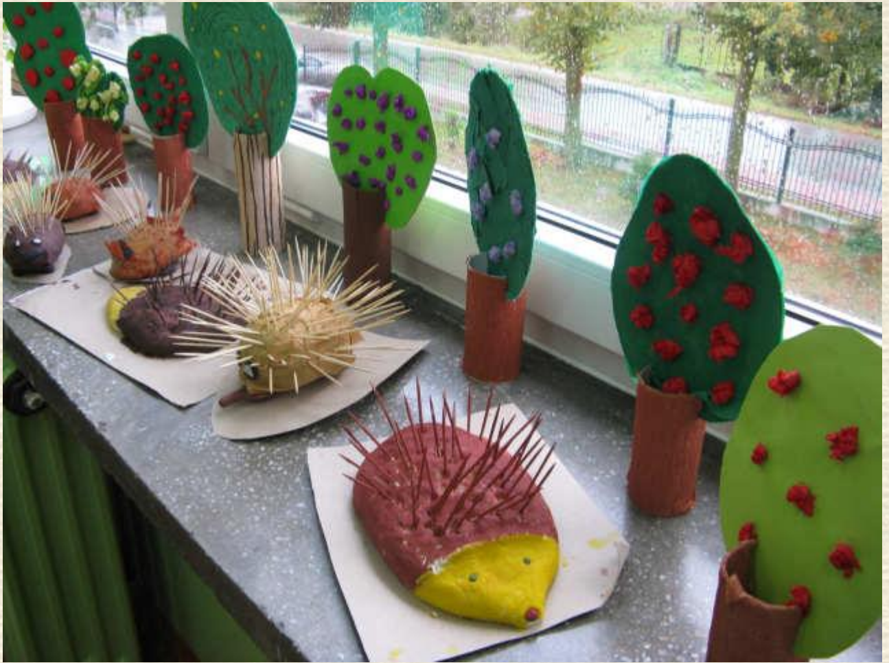
Praca nad plakatem o ochronie lasów