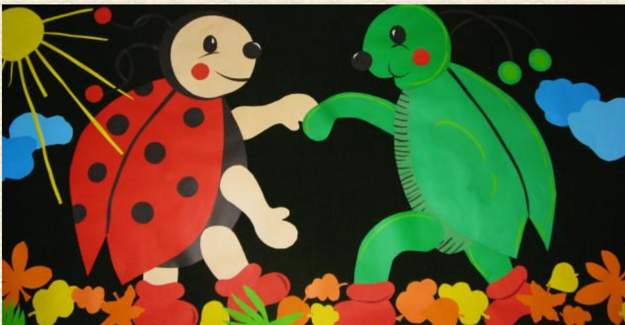
Gazetka klasowa - Nasza okolica