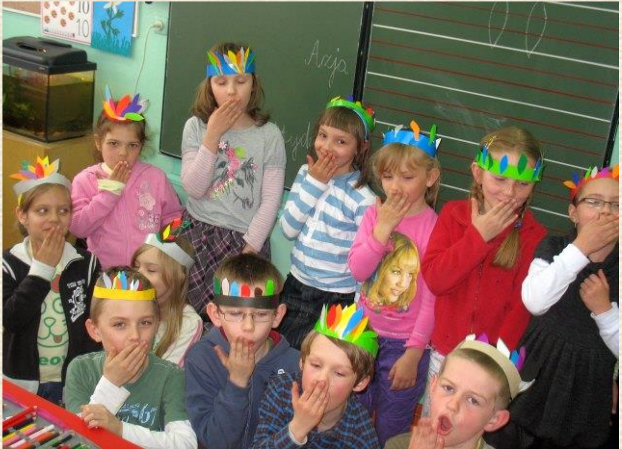
Zabawa w grupie